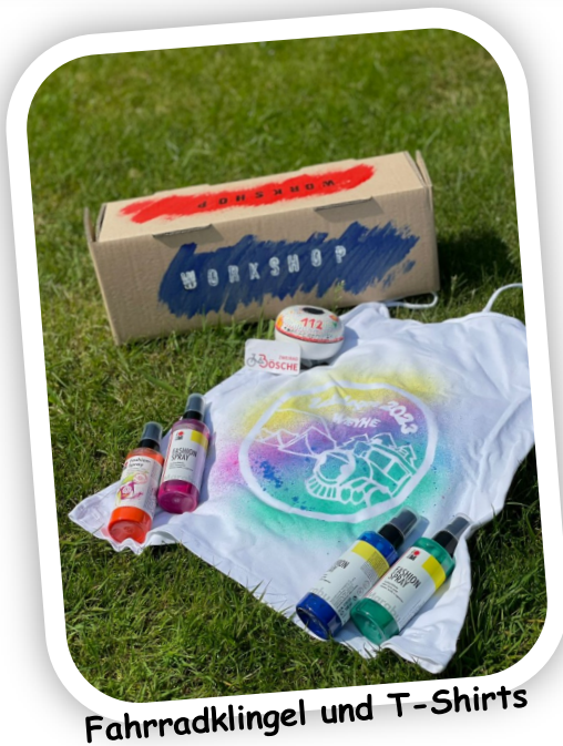
Fahrradklingel und T-Shirts