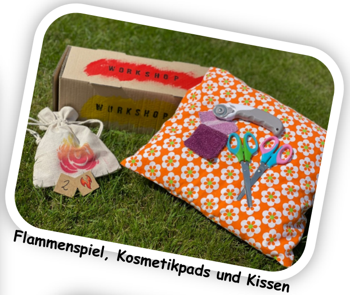
Flammenspiel, Kosmetikpads und Kissen