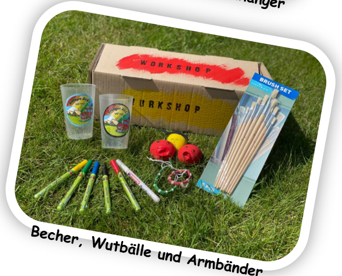
Becher, Wutbälle und Armbänder

Öffnungszeiten: von Sonntag bis Samstag täglich 10:00–12:30 Uhr und 13:30–17:00 Uhr