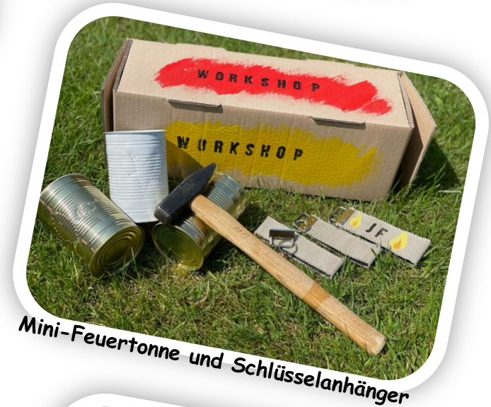
Mini-Feuertonne und Schlüsselanhänger